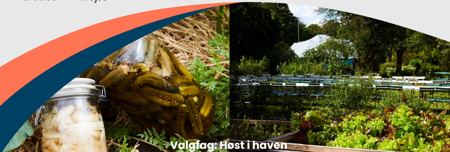
Valgfag: Høst i haven