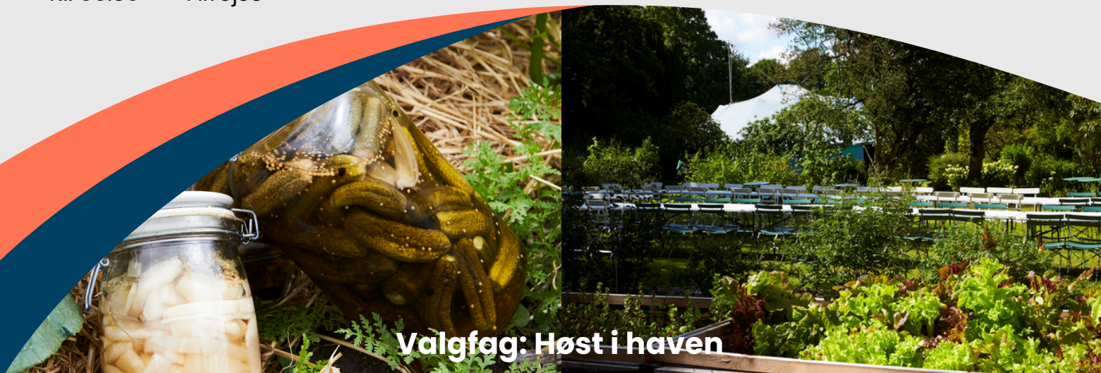
Valgfag: Høst i haven