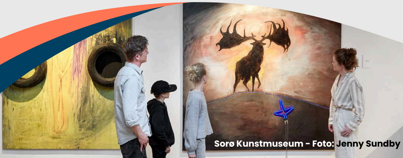
Sorø Kunstmuseum