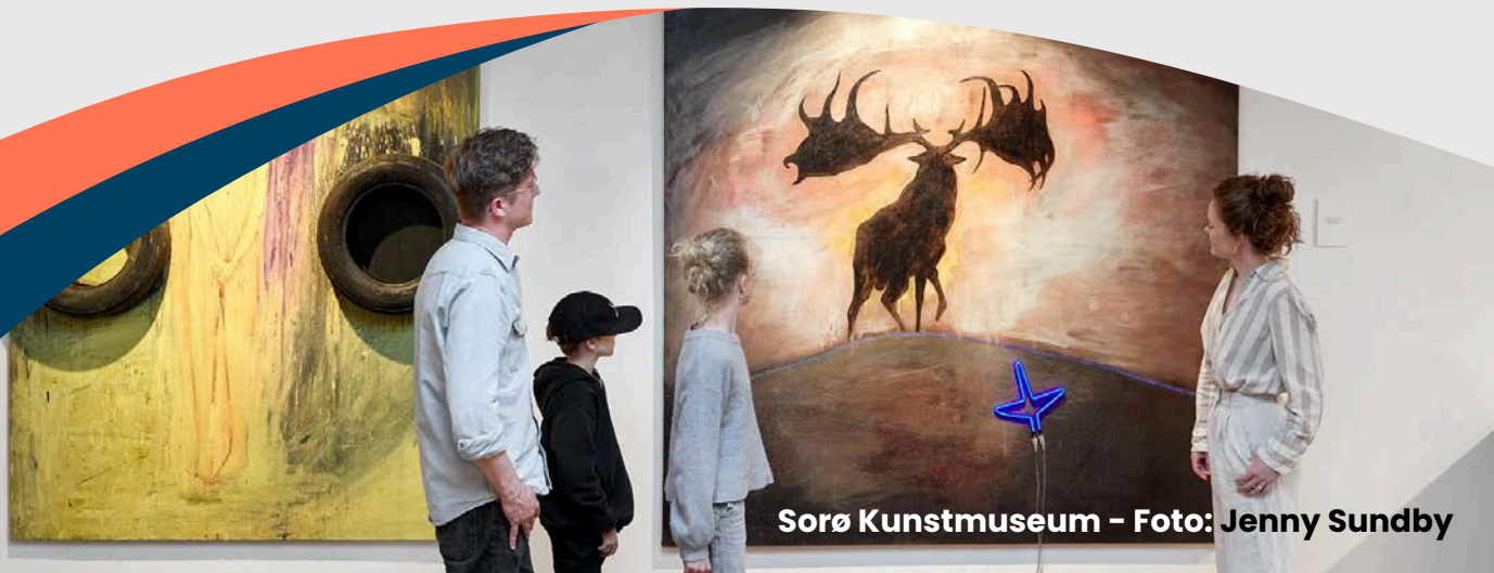
Sorø Kunstmuseum - Foto: Jenny Sundby