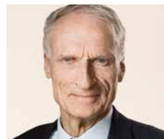
Bertel Haarder er MF for Venstre og bestyrelsesformand for Det Kongelige Teater.