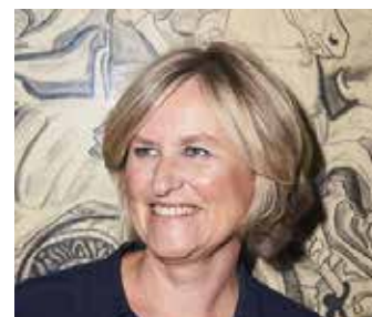
Ida Jessen er forfatter.