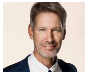
Stén Knuth er medlem af Folketinget for Venstre.