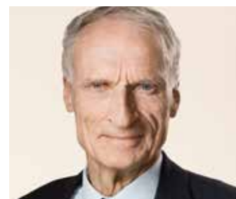
Bertel Haarder er MF for Venstre og præsident for Nordisk Råd.